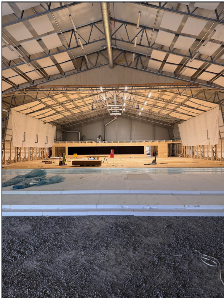
Tälthall; bild visar uppbyggnad av sportgolvet i hallen.