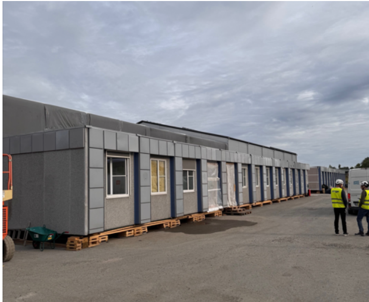
Omklädningsmoduler på plats framför tälthallarna.